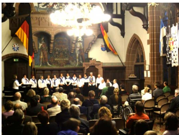
Jubiläumsfeier des Saarbrücker Behindertenbeirats im Rathaus, Dez. 2009

25% der gezählten Einzelkontakte beziehen sich jedoch auf die kontinuierliche Arbeit in Gremien und Arbeitskreisen sowie auf die Aktivitäten des Initiativkreises „Saarländisches Bündnis gegen Depression“ (s. Anhang). Die KISS übernimmt in den meisten Arbeitskreisen/Gremien gestaltende Funktionen z.B. Vorstand oder Moderation wahr und beteiligt sich auch in den zahlreichen Unterarbeitsgruppen. So entstand z.B. aus der Mitarbeit in der AG Freizeit beim Saarbrücker Behindertenbeirat eine Checkliste für barrierefreie Veranstaltungen, die der Oberbürgermeisterin zum Anlass des 20jährigen Bestehens des Beirats überreicht wurde.