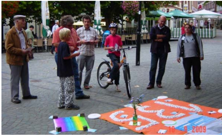
Aktion zum Welt-Tag der Suizidprävention am 10.9. in St. Wendel