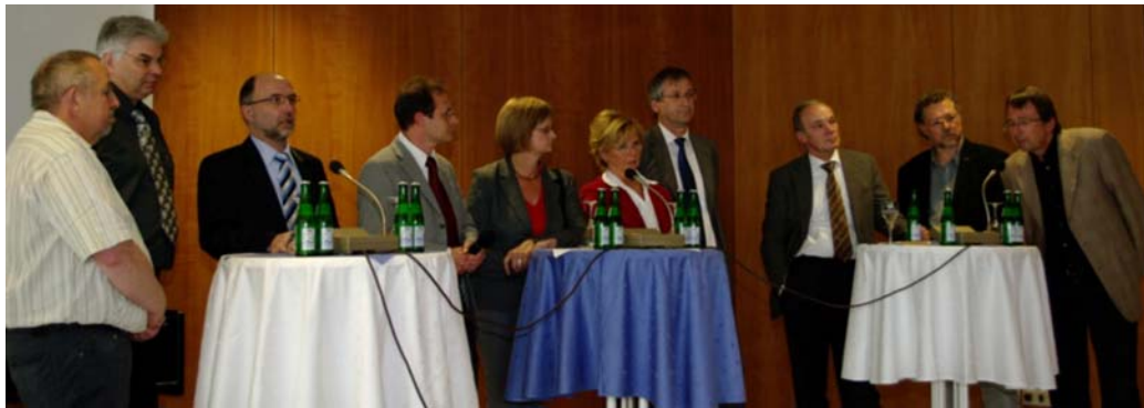
Gesprächsrunde bei der Auftaktveranstaltung 13. Mai

2009 lagen die Schwerpunkte der Kontaktstellenarbeit auf dem Aufbau und der Etablierung des Saarländischen Bündnisses gegen Depression, das am 13. Mai mit einer großen Auftaktveranstaltung aus der Taufe gehoben wurde, und im ersten Halbjahr auf der Mitorganisation und Durchführung der Jahrestagung der Deutschen Arbeitsgemeinschaft Selbsthilfegruppen, dem Fachverband für Selbsthilfeunterstützung. Vom 3. – 5. Juni diskutierten 140 Fachleute aus der gesamten Bundesrepublik unter dem Titel „Alles bleibt anders“ neue Formen in der Selbsthilfe und der Selbsthilfeunterstützung. Das erste Mal seit 20 Jahren waren damit VertreterInnen anderer Kontaktstellen und Selbsthilfeverbände zu einem fachlichen Austausch zu Gast im Saarland und konnten sich vor Ort ein Bild machen von der Arbeit der KISS und den Vorzügen des Saarlandes. Die Schirmherrschaft über diese Fachtagung mit hochkarätigen ReferentInnen hatte der damalige Gesundheitsminister Vigener übernommen, gefördert wurde sie vom Bundes- und vom saarländischen Gesundheitsministerium sowie der IKK Südwest.