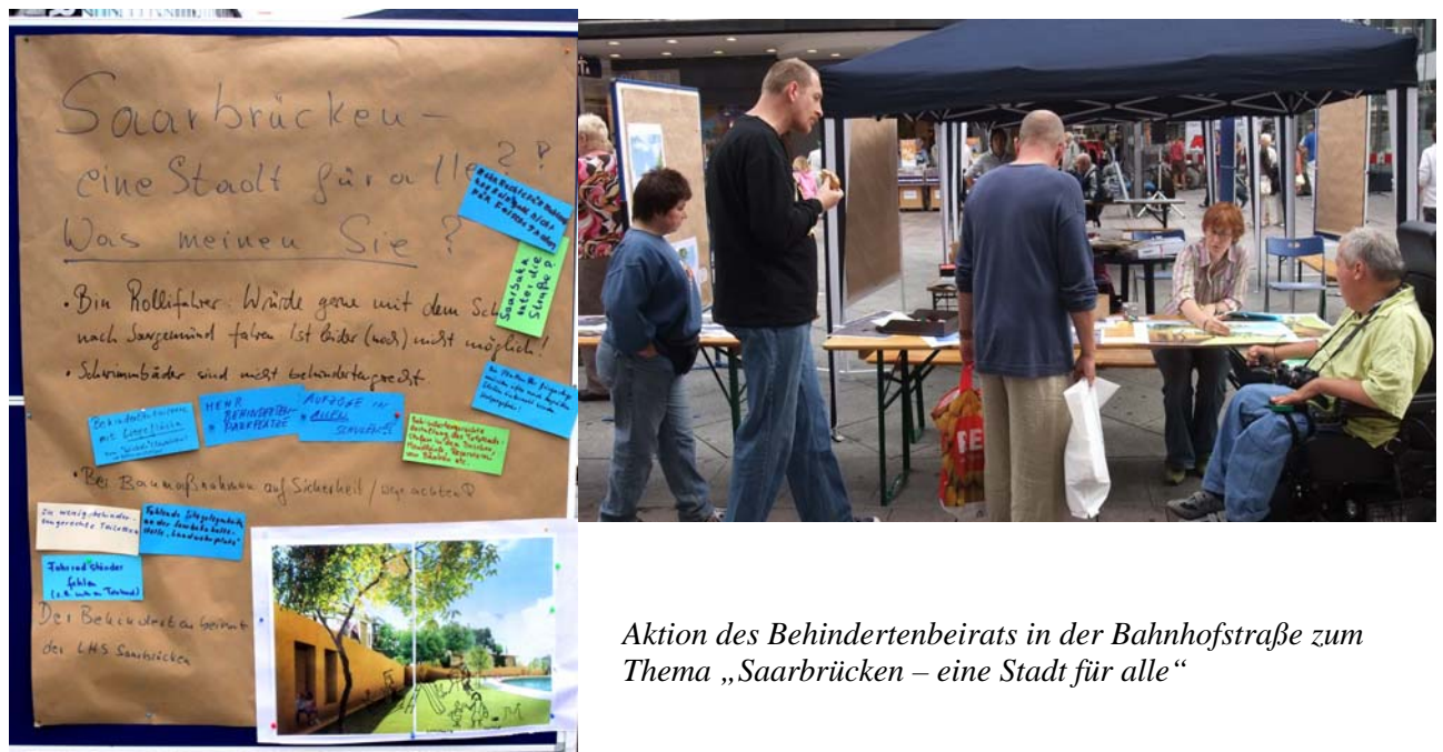
Aktion des Behindertenbeirats in der Bahnhofstraße zum Thema „Saarbrücken – eine Stadt für alle“

Als besonders arbeitsintensiv erwiesen sich der Aufbau und die Etablierung des Saarländischen Bündnisses gegen Depression, das vor allem in seinem ersten Jahr verstärkt Aktionen in der Öffentlichkeit durchführte wie Informationsstände, Veranstaltungen, Vorträge etc. Es galt die starke Einbindung der Selbsthilfe in den Initiativkreis und die Aktionen zu gewährleisten, eine gemeinsame Schwerpunktsetzung festzulegen und eine Finanzierung des Projektes auf den Weg zu bringen. Dazu bedurfte es zahlreicher Gespräche, vielfältiger Abstimmungen und umfangreicher Antragstellungen. Es ist sicherlich als Erfolg zu werten, dass das Bündnis durch das saarländische Gesundheitsministerium und alle gesetzlichen Krankenkassen aus Projektmitteln gefördert wird.