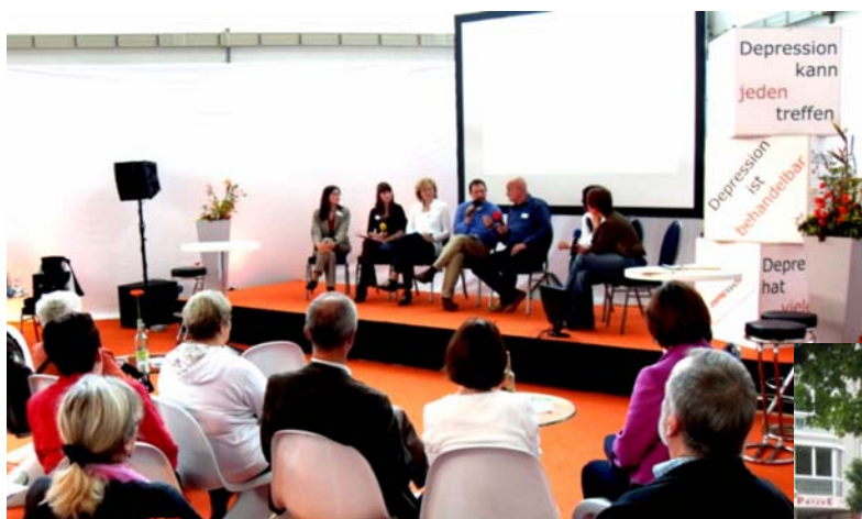
Veranstaltung „So nah und doch so fern“ auf der Welt der Familie