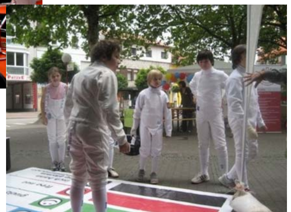
„Stimmungstest“ beim Familientag in Völklingen